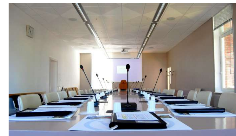
Salle du conseil

Tandis qu'à l'étage se trouvent une salle de réunion du conseil et une salle des mariages. Les archives de la ville sont, elles conservées au 2ème étage.