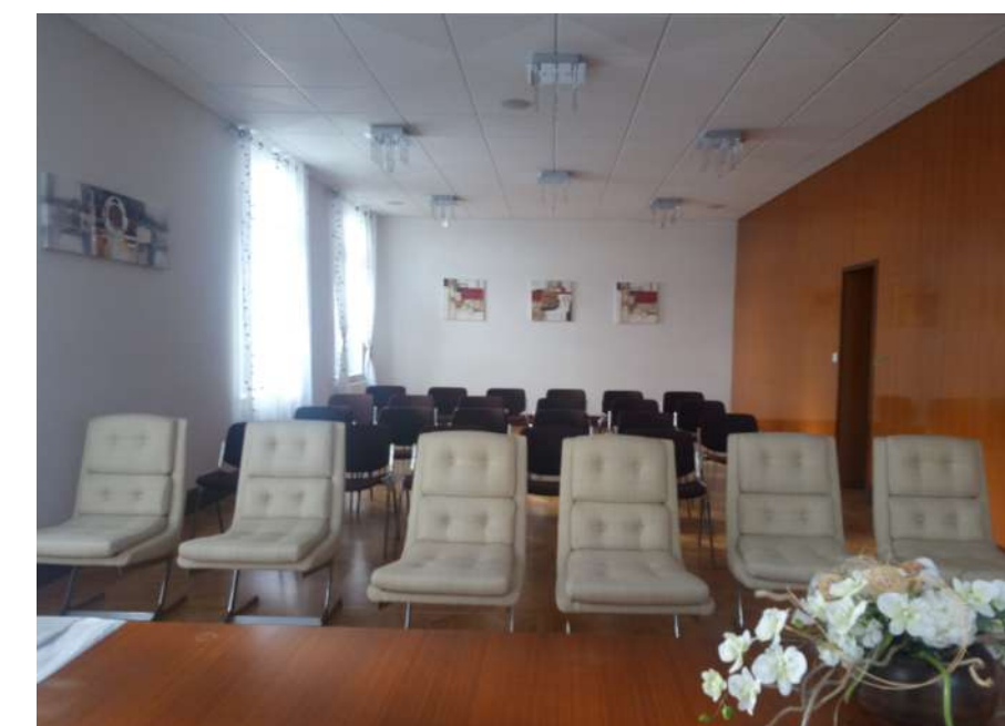
Salle des mariages