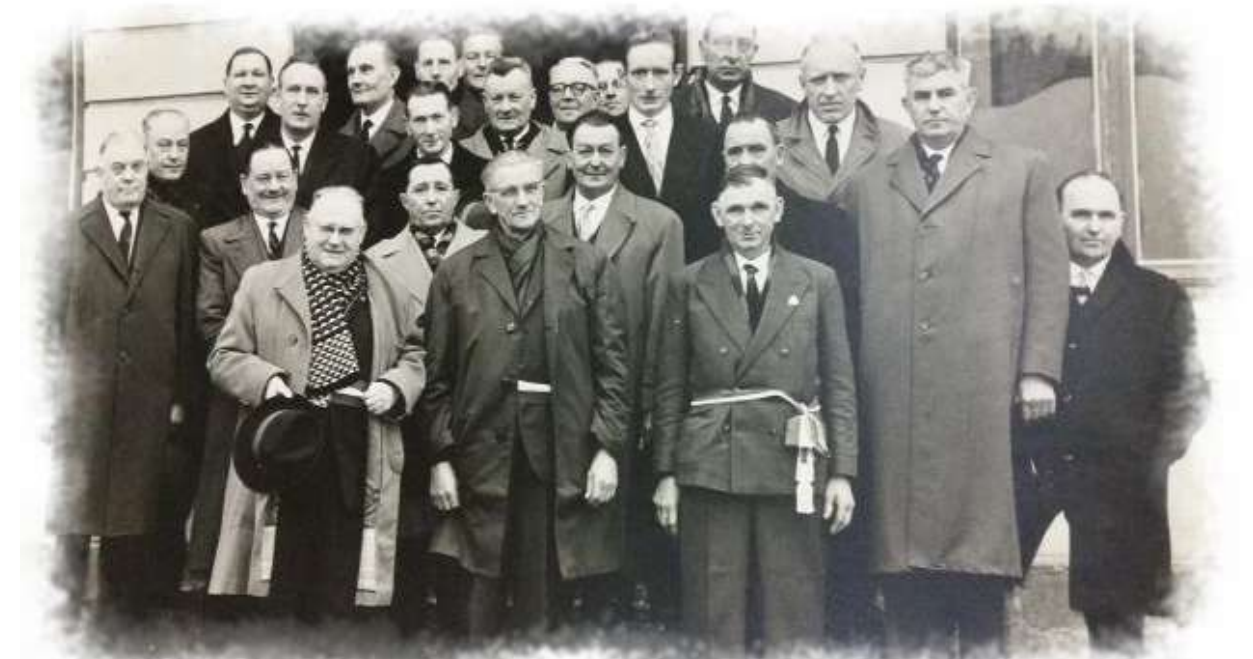
Le dernier conseil municipal devant l'ancienne mairie