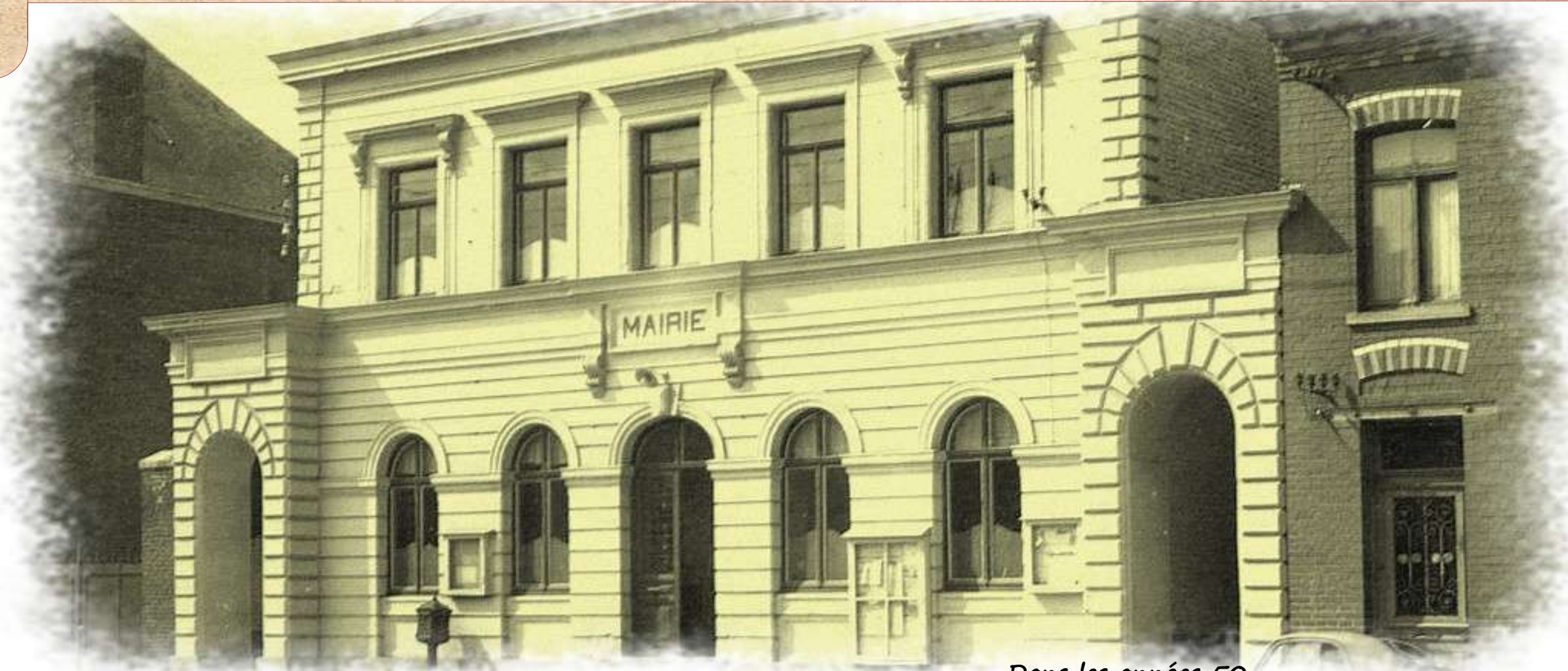
Dans les années 50