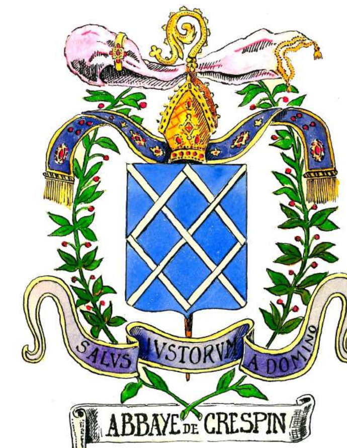
Le blason de l'abbaye

Aujourd'hui, il reste de l'Abbaye : la porte d'entrée de la cour des communs, des dépendances et la maison abbatiale - reconverties en logements - une partie du mur d'enclos, le grand moulin et les colonnes. Ces bâtiments sont inscrits à l'inventaire supplémentaire des monuments historiques.