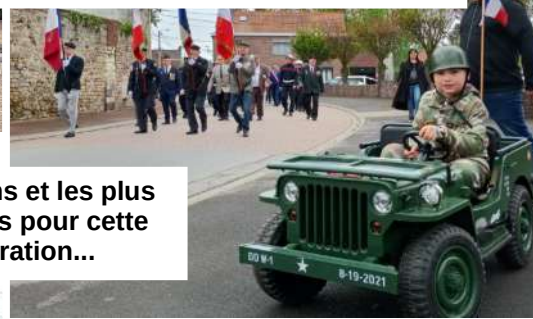
Les anciens et les plus jeunes unis pour cette commémoration...