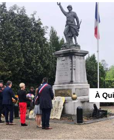
À Quiévrechain, Thivencelle et Saint-Aybert