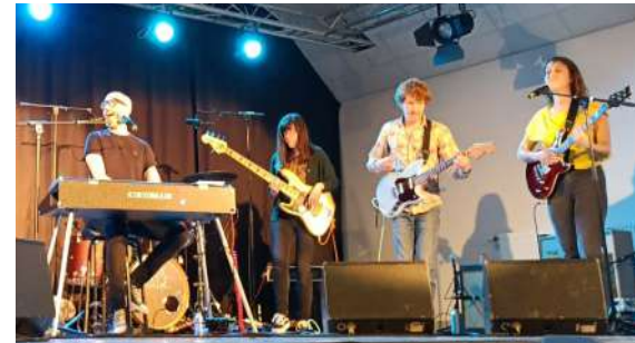
Les Musiciens du Collectif « Bougez Rock »