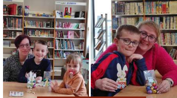
Activité pour Pâques

À la rentrée prochaine de nouvelles activités vont voir le jour ! Soyez attentifs à la page de la médiathèque, des annonces seront faites à la fin de la saison.