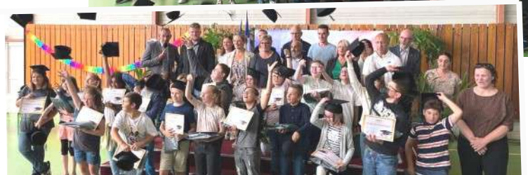
En route vers le collège pour plus de 70 élèves

Les futurs collégiens ont été coiffés d'une toque d'étudiant par les membres du conseil avant d'être appelés par leur nom pour la remise des récompenses : Une calculatrice scientifique spéciale collège et quelques friandises offertes par la municipalité ainsi qu'un recueil des Fables de la Fontaine offert par l'Education Nationale pour les féliciter du travail accompli mais aussi leur souhaiter succès, réussite et épanouissement au collège.