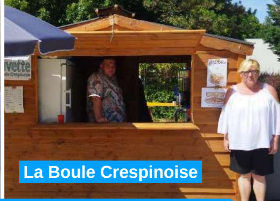
La Boule Crespinoise