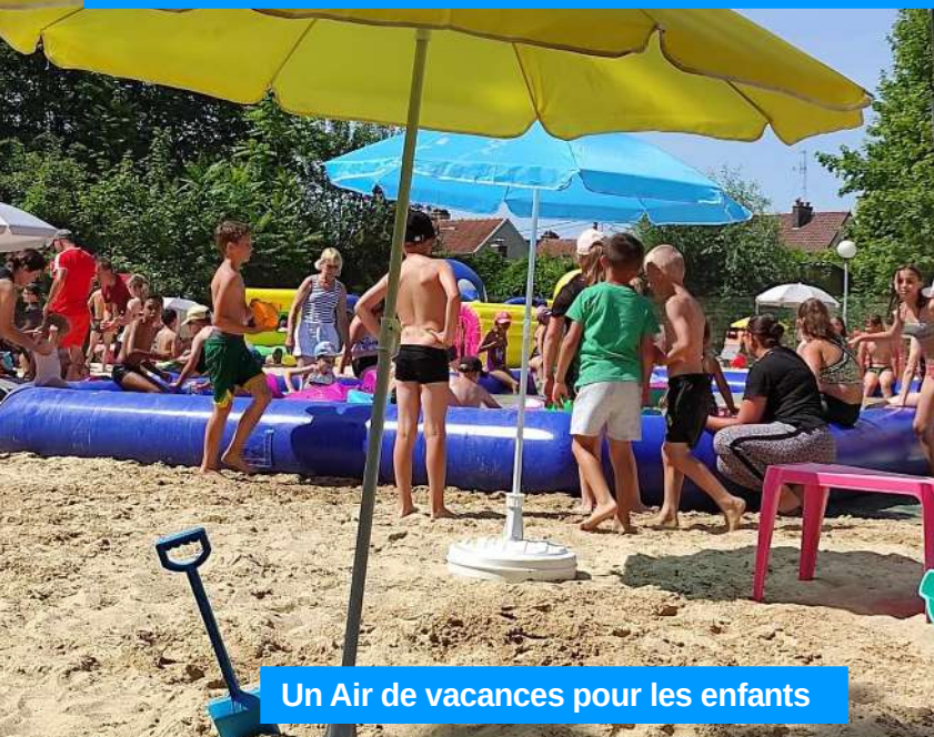
Un Air de vacances pour les enfants