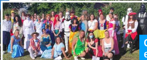
Un Centre Aéré sous le soleil (P6-7)