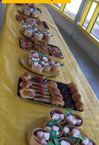
Goûter de Pâques

Les vacances se terminent et pour l'E.S.C, c'est déjà la reprise.