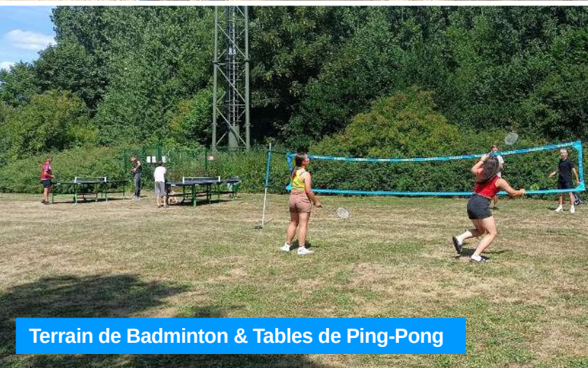
Terrain de Badminton & Tables de Ping-Pong