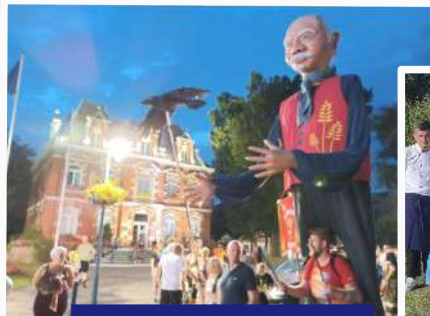
Le 13 Juillet (P8)