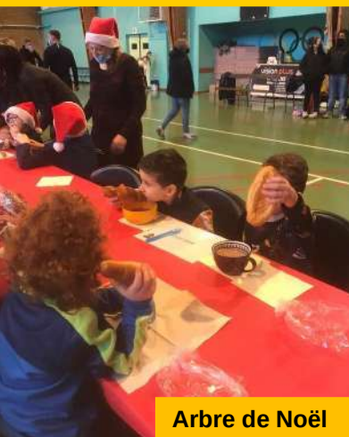
Arbre de Noël