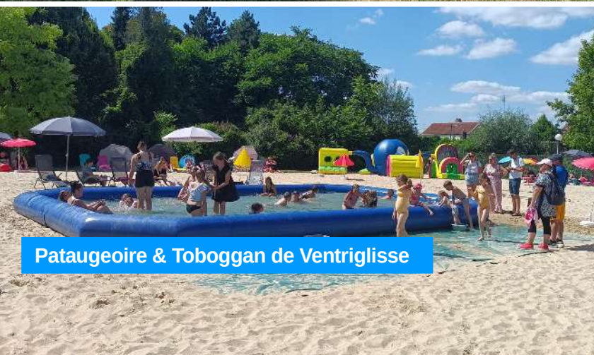
Pataugeoire & Toboggan de Ventrigrisse