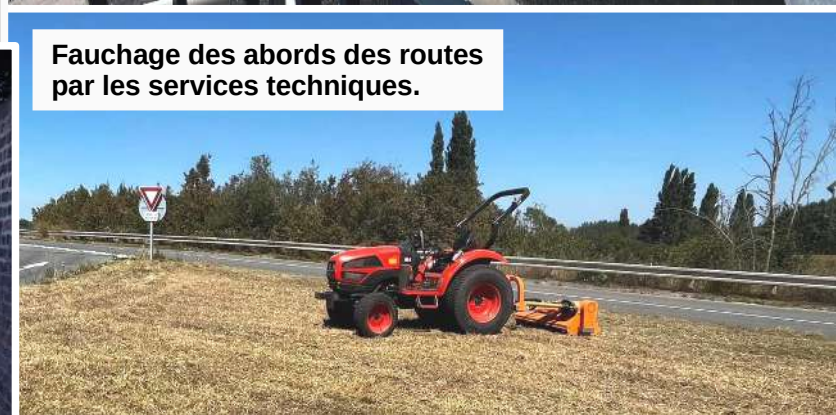
Fauchage des abords des routes par les services techniques.