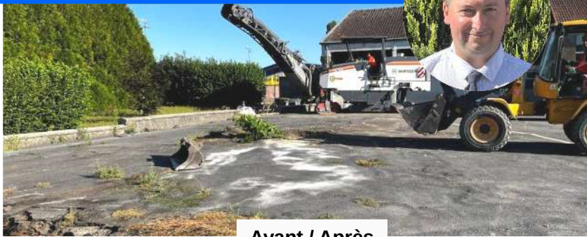
Avant / Après