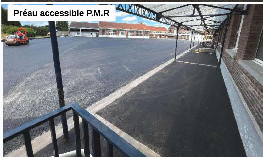
Préau accessible P.M.R