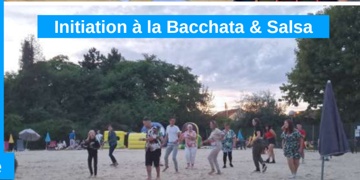
Initiation à la Bacchata & Salsa