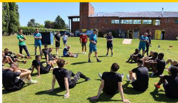
Francs-Borains à Crespin