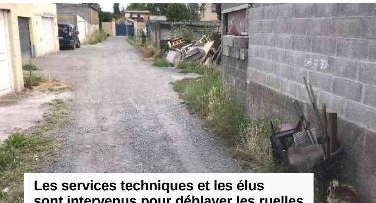
Les services techniques et les élus sont intervenus pour déblayer les ruelles