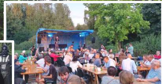
Carte postale de Crespin Plage et des festivités estivales (P10-11)